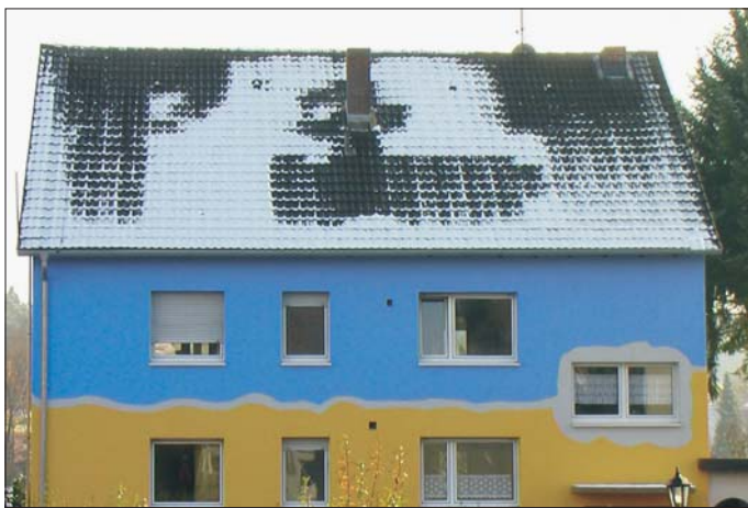
Der Beweis für teuren Wärmeverlust: Abgetaute Stellen auf dem Dach

Schlecht gedämmte Dächer sind mit bloßem Auge erkennbar: Wenn es leicht geschneit hat oder der Frost seinen Raureif auf die Dacheindeckung gelegt hat, zeigen die abgetauten Stellen, dass hier eine Menge Geld zum Dach hinaus geheizt wird. Die abgeschmolzenen Flecken sind der sichere Beweis, dass die teure Heizenergie die Dachhaut übermäßig erwärmt. Hohe Wärmeverluste sind die Folge.