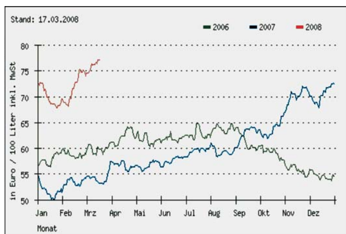
Ca. 85% Preisteigerung innerhalb von 2 Jahren - www.fastenergy.de

Die finanziellen Verluste sind enorm! Lag der Heizölpreis vor Jahren noch bei ca. 35 ct / Liter, müssen Hausbesitzer und Mieter heute bereits über 70ct / Liter für die Energiekosten veranschlagen. Eine Verbesserung der Preissituation ist nicht in Sicht.