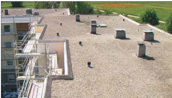
Häufig anzutreffen: Bekieste Bitumendächer mit Lüftern und Kaminen erschweren den Zugang zum Dämmhohlraum.

Daher kann es nicht verwundern, dass isofloc diese Dämmaufgabe enorm kostengünstig gemeistert hat.