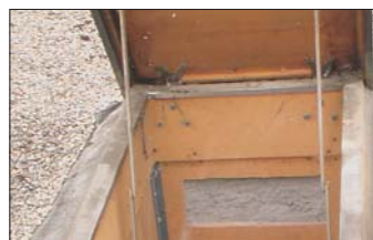
Zusätzliche Einblasöffnungen garantieren optimale Dämmstoffverteilung.

Bei der Montage arbeiten Dachdecker und Dämmprofi Hand in Hand: Kurz vor dem Ausflocken wird die Einblasöffnung in das Dach geschnitten. Sofort nach dem Dämmen verschweißt der Handwerker diese Öffnung wieder fachgerecht.