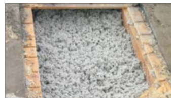
Gleichmäßige Dämmschicht